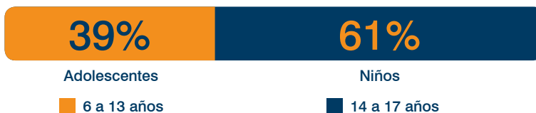
Perú: Distribución del Trabajo Infantil y Adolescente por grupos de edades 2001

De modo que el problema del trabajo infantil y adolescente hace mucho dejó de ser un asunto marginal para convertirse en un problema de política social de primer orden.